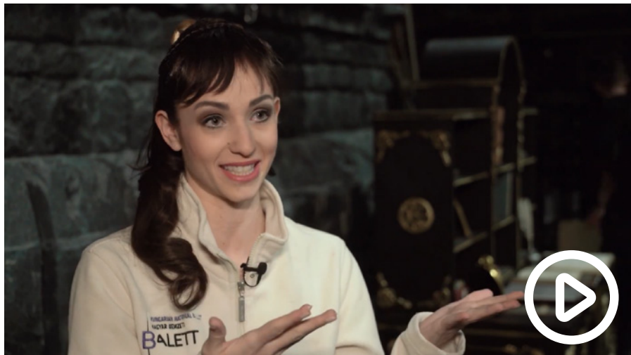
A KULISSZÁK MÖGÖTT