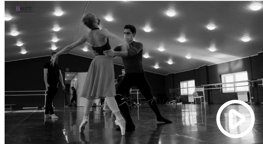
BEPILLANTÁS A PRÓBATEREMBE