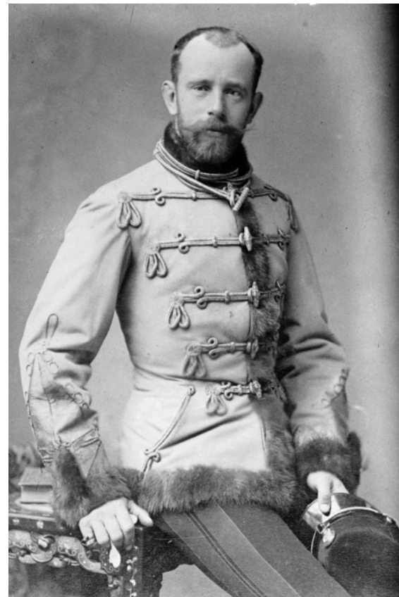
Rudolf főherceg 1887-ben

de Ferenc József és Rudolf kapcsolata egészen másképp alakult. Rudolfot nehéz, fájdalmakkal teli gyermekkor egy szélsőségesen ingadozó kedélyállapotú férfitáta, őrzöngő szexuális készlettel, amivel melankóliáját, depresszív hangulatát és magányát leplezte el. Asztmás pánikrohamaira rendszeresen morfiúmot szedett. Rudolf elszigeteltsége , valamint az udvar és a vezető kormánykörök bizalmatlansága egyre fokozódott. Rudolf sem a házasságában, sem az udvarban rá hárult jelentéktelen reprezentációs feladatokban nem talált örömet . Vadászattal és lovaglással töltötte ideje nagy részét, kicsapongó életet élt. A tragédiához vezető útra akkor lépett, amikor 1888-ban Larisch grófnő közvetítésével megismerkedett Vetsera Mária bárónővel. A legvalószínűbb feltételezések szerint a kilátástalan magánéleti helyzet és a politikai körülmények miatt választotta szerelmével a kettős öngyilkosságot.