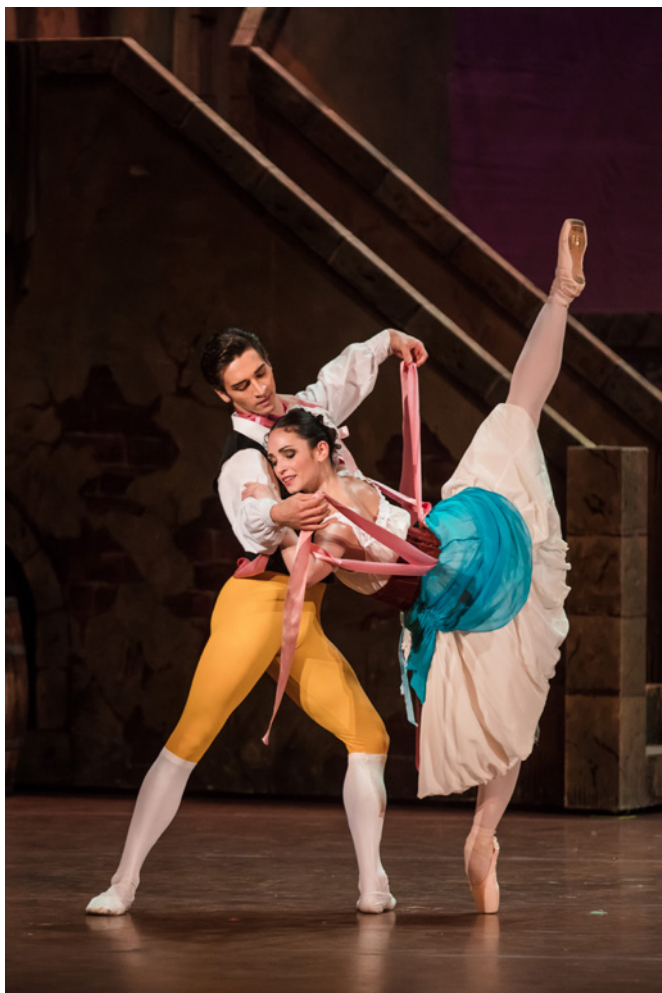
A rosszul őrzött lány

John Arthur Lanchbery (1923–2003) angol-ausztrál zeneszerzőt és karmestert nagyszerű balettfeldolgozásairól ismerte meg a világ. Első baletthez köthető munkája a Metropolitan Balett zeneigazgatói pozíciója volt 1947–1949 között. 1951-ben lett a Sadlers Wells Theatre Ballet (ma: Birmingham Royal Ballet) tagja, és velük turnézott Észak-Amerikában.