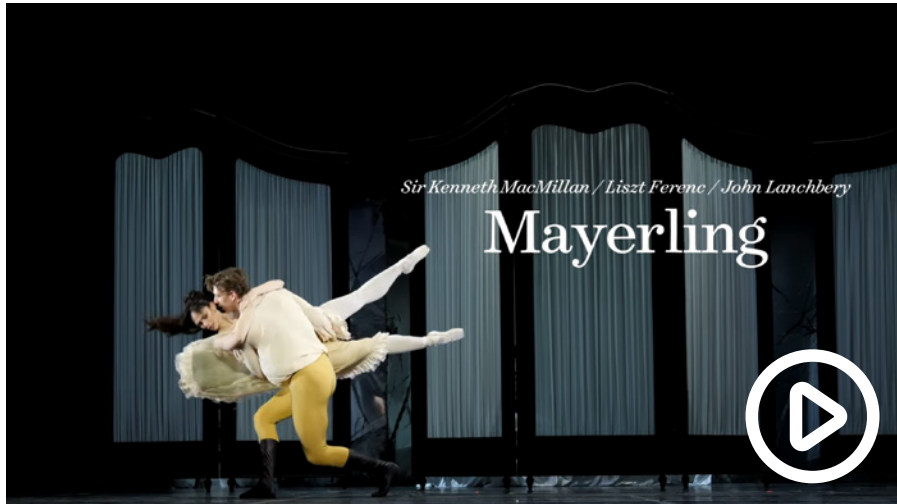
ÍZELÍTŐ AZ ELŐADÁSBÓL