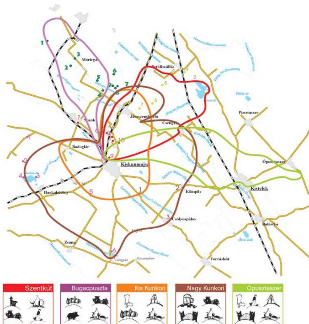
1. ábra Túraútvonalak