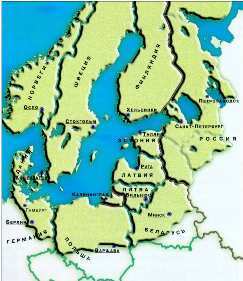
1. ábra. A Balti régió